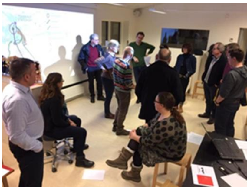
Workshop på Overmarksgården